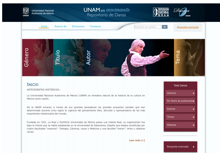
Imagen 1. Imagen de la pantalla de inicio del repositorio Danza UNAM.

La búsqueda de información en el catálogo se puede realizar de manera sencilla, pues éste puede ser consultado desde cualquier computadora conectada a Internet, sin ninguna restricción, mediante el siguiente enlace: ru.unamemovimiento.unam.mx . Una vez desplegada la página de inicio se visualiza el menú principal, en el que se puede iniciar la búsqueda de información por palabra o por medio de los siguientes puntos de acceso: Género, Título, Autor, Tema, así como la opción de Búsqueda avanzada. Lo siguiente es ingresar el término que nos interesa en la caja de búsqueda.