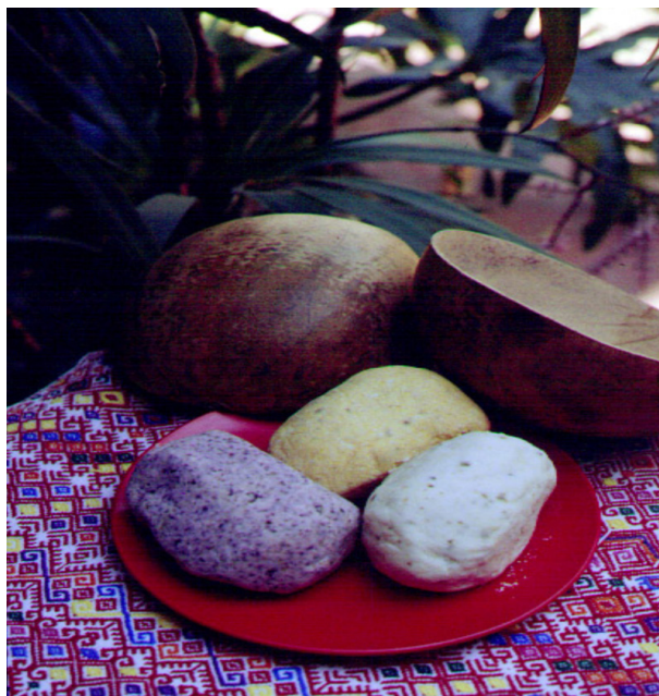
Figura 6. Pozol de maíz blanco, amarillo y azul de Chiapas.

con bolas de masa de maíz nixtamalizado (ya sea blanco, amarillo o negro) envueltas en hojas de plátano que se dejan fermentar por tiempos que varían considerablemente, ya que en algunos casos sólo se fermenta por unas horas, mientras que en otros el tiempo de fermentación es de varios días (3 a 7 días), pero puede incluso llegar a ser de hasta un mes. Las bolas de maíz fermentado se consumen disueltas en agua durante la comida, el trabajo o a cualquier hora del día como una bebida refrescante. También tiene usos medicinales, rituales y, debido a su alto grado de conservación, las bolas de pozol son utilizadas como provisiones en travesías largas. Los