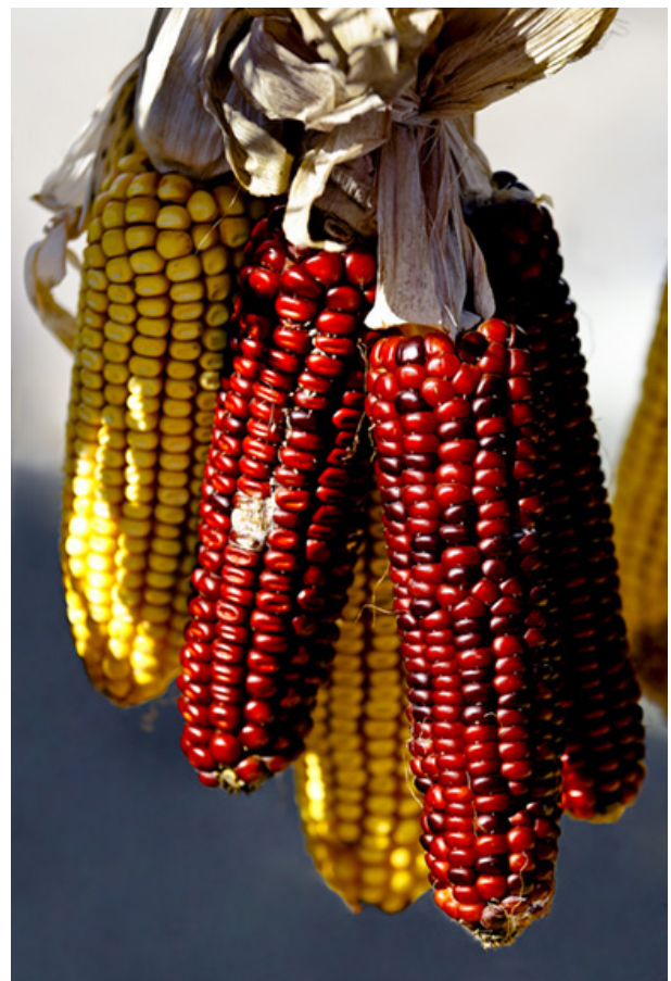
Figura 5. Mazorcas de maíz rojo y amarillo.

Una larga lista de sustancias se agregaría poco a poco a los ácidos cítrico y glutámico, dentro de los ingredientes básicos para la alimentación, elaborados mediante procesos industriales. Esta lista incluye hoy vitaminas, aminoácidos, gomas (como las xantanas empleadas como espesantes), el ácido láctico, edulcorantes no calóricos, como el aspartame, enzimas para una enorme diversidad de aplicaciones como el procesa-