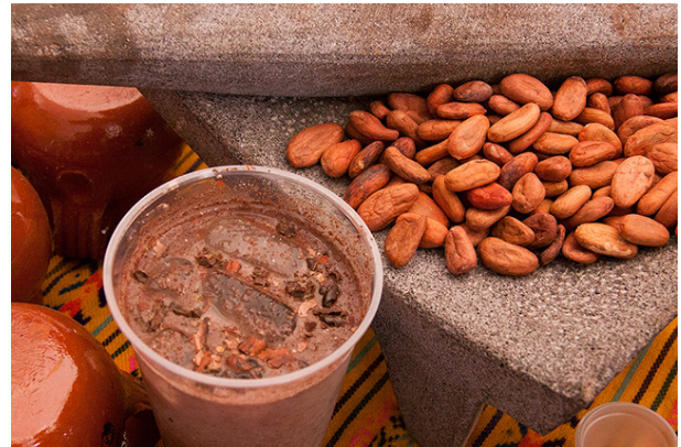
Figura 7. Pozol preparado con cacao.

Además, varios estudios han puesto en evidencia el que Agrobacterium azotophilum tiene actividad bactericida, bacteriolítica, bacteriostática y fungistática contra algunos microorganismos patógenos para los seres humanos, tales como Escherichia coli o Micrococcus luteus , lo cual contribuye a la reducción o eliminación de los microorganismos patógenos y a la inocuidad del producto.