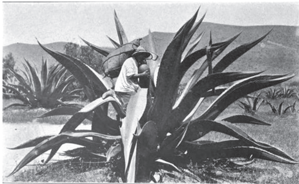
EXTRACTING THE FAVORITE PULQUÉ—THE CURSE OF THE PEON.