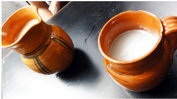
Figura 2. El pulque es una bebida fermentada que con- serva un método de elabora- ción original prehispánico.

No fue sino hasta el siglo XVIII que Antonie van Leewenhoek desarrolló los lentes que más tarde dieron lugar al microscopio, instrumento que permitió a los seres humanos adentrarse en el mundo invisible que nos rodea, mundo en el que los microorganismos son los habitantes centrales. Un siglo después, Pasteur relacionó los microorganismos con la descomposición y con la fermentación, y Koch, con las enfermedades. Aunque de todo esto hace menos de dos siglos, es sólo durante las últimas décadas que se ha puesto en evidencia que la gran mayoría de los alimentos fermentados cuentan con una serie de propiedades fundamentales para una dieta variada y equilibrada, quizás una de las razones por las cuales su preparación y consumo se ha mantenido hasta nuestros días. En casi todos los casos, estos productos están fuertemente arraigados a la cultura de las regiones en las que fueron desarrollados o adaptados; en otros casos los alimentos se han beneficiado de los avances científicos y tecnológicos, como la cerveza, el vino o la producción de yogurt; en otros, el proceso se mantiene con muy poca innovación: tal es el caso del pozol o del pulque en México.