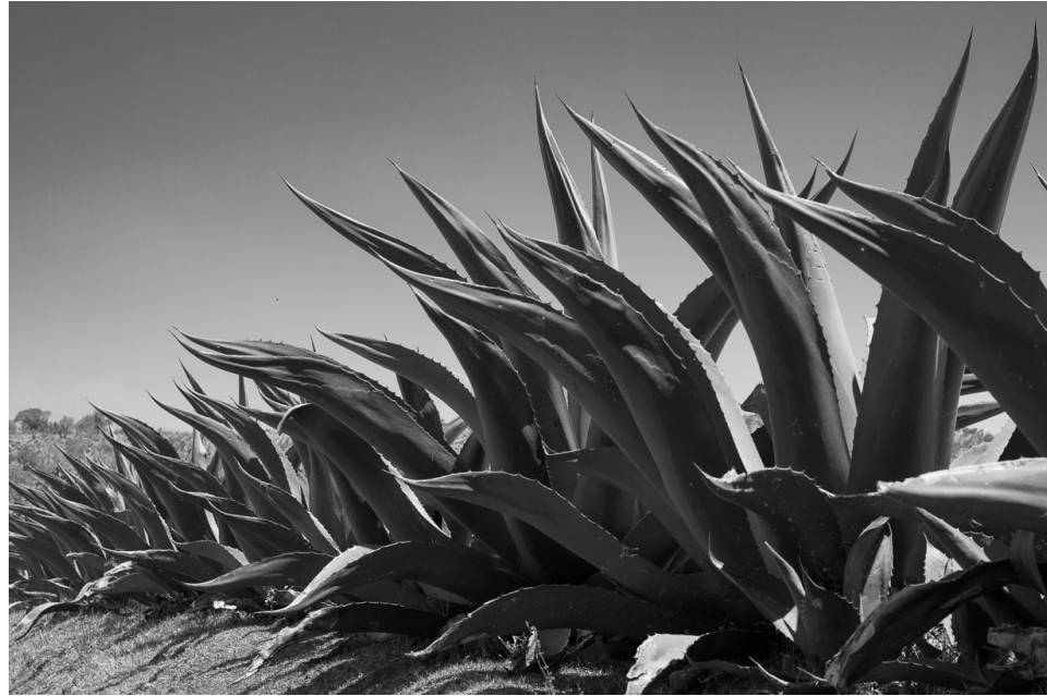
Figura 3. Plantío de maguey, planta de la familia de las agavaceas de la cual se extrae el aguamiel materia prima del pulque.

Es evidente que una buena parte del interés por conocer la cocina indígena tiene como objetivo el aprovechamiento y promoción de los productos de nuestro país, particularmente aquellos que resultan interesantes, ya sea por el uso de recursos naturales locales o por las propiedades nutraceuticas del mismo.