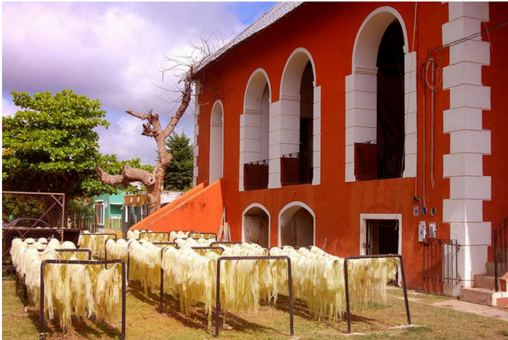
Aspecto actual de una hacienda henequera en el estado de Yucatán.

La siembra y explotación de henequén requería mano de obra abundante y permanente. Por eso, para la hacienda henequera, la disponibilidad de tierras era un factor secundario, subordinado a la existencia de mano de obra “arraigada”. Fue así como la producción henequera se fue ampliando de manera extensiva, estableciendo nuevas haciendas, como unidades independientes, que reproducían internamente, las formas de organización y el acasillamiento de la mano de obra endeudada (Katz: 1980).