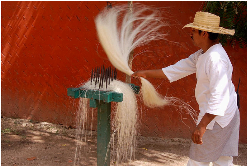
Trabajador de una hacienda henequenera en el estado de Yucatán.