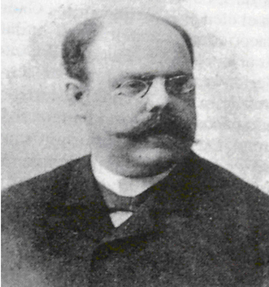
Ernesto Villar en el año 1894