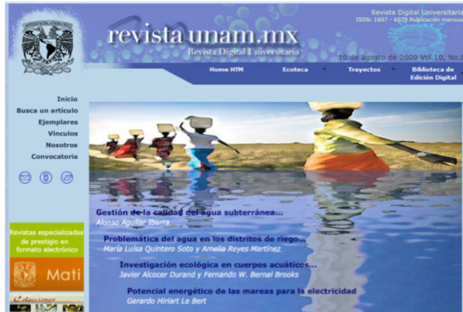
Imagen 2. Incorporación del multimedia.