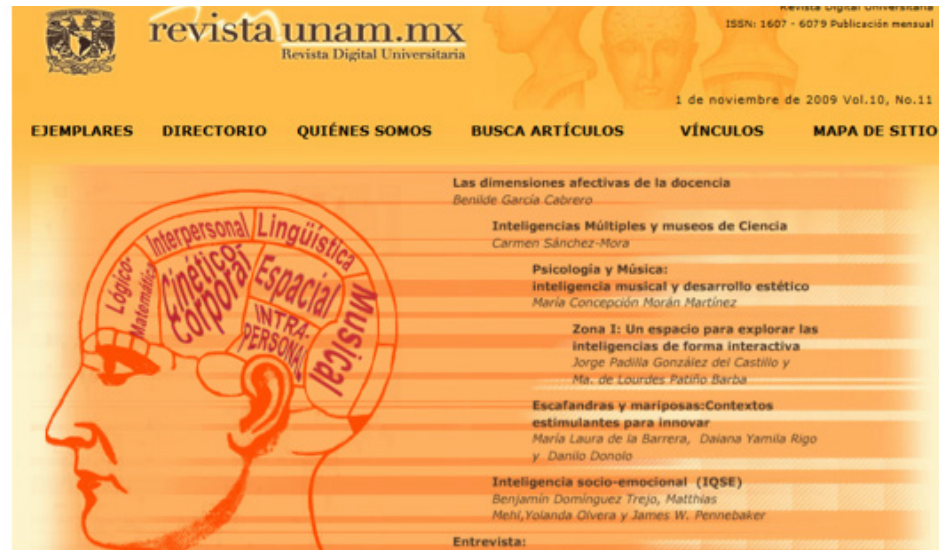
Imagen 3. Primer ejemplar de la tercera época.