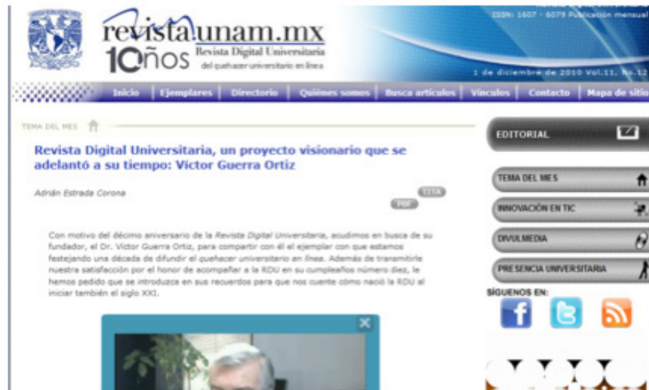
Imagen 4. Aniversario 10 de la RDU.