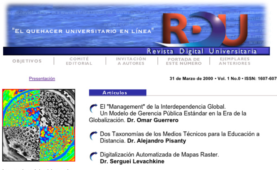
Imagen 1. El ejemplar No. 0

Todo se realizó en tiempo. El ejemplar se publicó el día acordado, con los siguientes artículos: