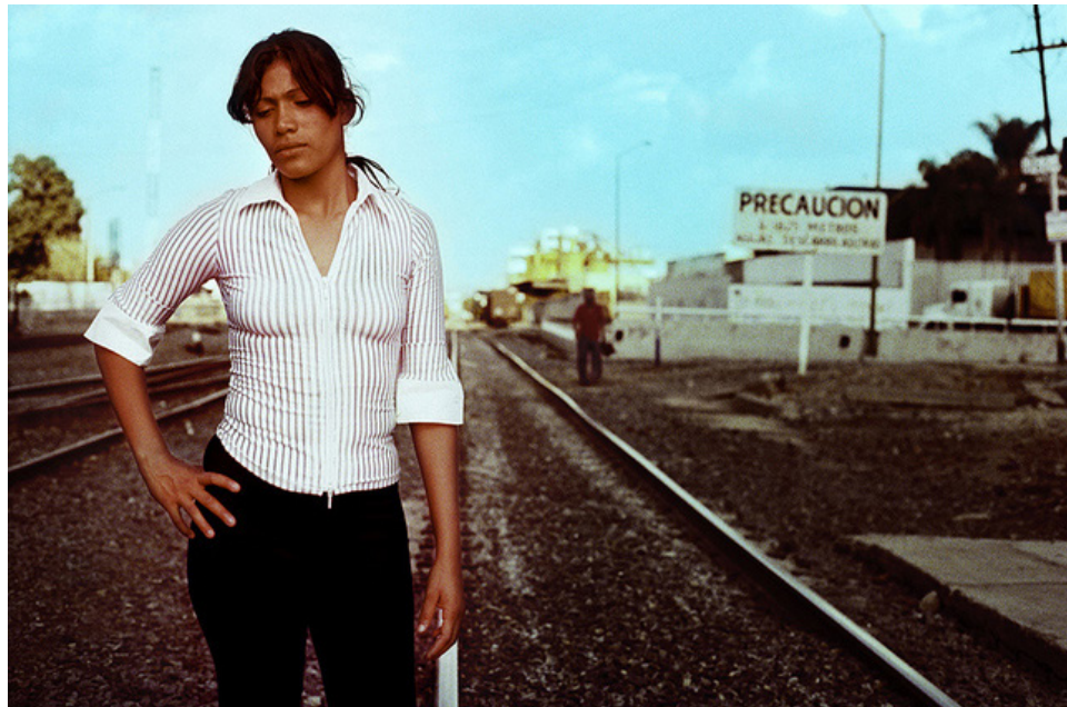
Foto: Liliana Zaragoza Cano, de la serie: "ZMG Paso Libre" en colaboración con FM4 Paso Libre.

El nombre mismo de la novela deja entender, transparentemente, que en la vida no todos pasan al mismo tiempo. La burocracia se mueve, lenta, en fila india. Avanza siguiendo una aparente jerarquía. Por otro lado, hay una larga cola para formarse en búsqueda de una oportunidad o, siquiera, la dignidad básica que consideramos un dere-