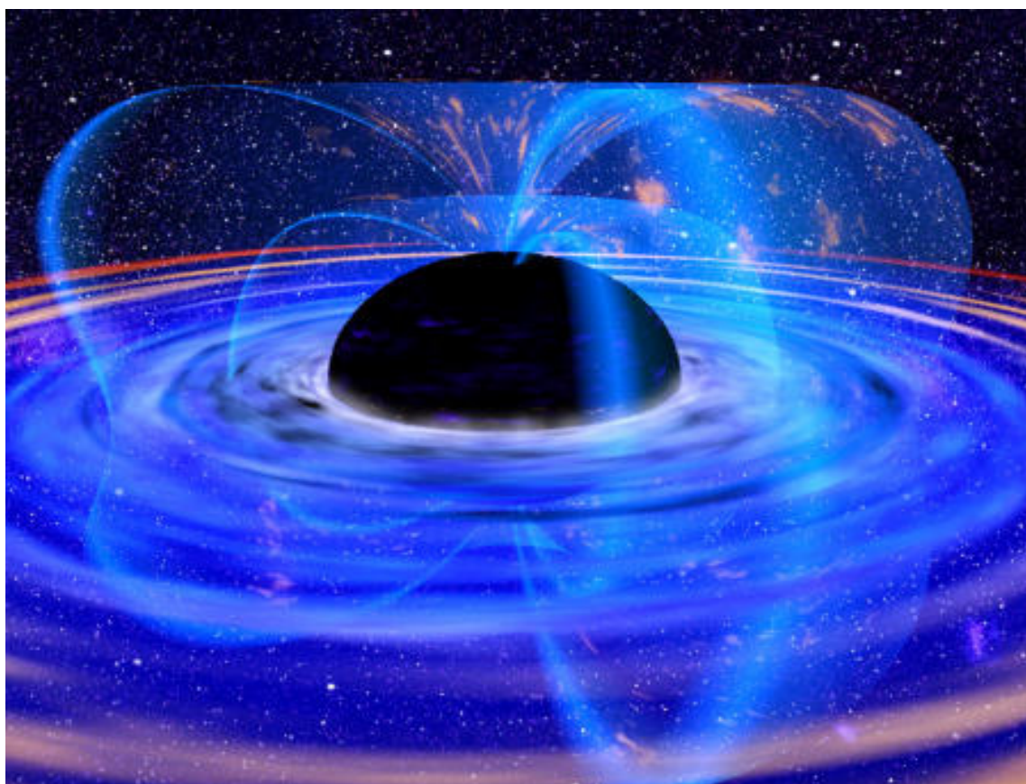
Figura 2. Ilustración de un disco de acreción alrededor de un agujero negro supermasivo.

El modelo más aceptado para explicar las altas luminosidades observadas en estos objetos plantea la existencia de un agujero negro supermasivo (con masa de millones a miles de millones de veces la masa del Sol), que “acreta” el material que se encuentra en sus cercanías formando un disco. El proceso de acreción de material es ideal para convertir la energía potencial y cinética del material en radiación. Durante el proceso de acreción, al menos un 10% de la energía equivalente a la masa del material en reposo puede ser liberada en forma de luz. De echo, este es el proceso más eficiente de conversión de masa en energía que involucra materia “normal” (es decir que no involucra aniquilación de materia y anti-materia).