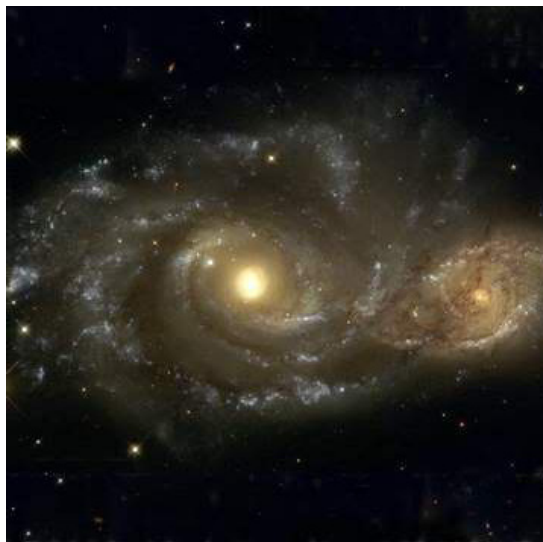
Figura 3. Foto del telescopio espacial Hubble de la colisión entre dos galaxias con morfología espiral.

Una de las preguntas fundamentales que se deben resolver es de dónde proviene el material que alimenta al agujero negro central. El brillo de un objeto nos da una medida de la cantidad de material que se traga un agujeronegro por unidad de tiempo, es decir, de la tasa de acreción de masa. Los núcleos galácticos activos más luminosos (brillos de miles de veces mayor al de toda la galaxia en la que se encuentran) requieren “comerse” alrededor de 20 veces la masa del Sol por año para producir la cantidad de luz observada. Dado que se estima que los núcleos de las galaxias activas pueden brillar continuamente por cerca de 100 millones de años, cada uno de ellos requeriría comerse del orden de 2000 millones de veces la masa del Sol. ¿De dónde sale o cómo llega esta cantidad de material al centro de las galaxias?