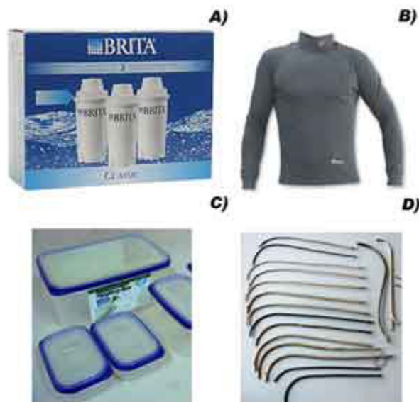
Figura 4. Diversos productos en el mercado que son antimicrobianos debido a que se añaden compuestos de plata. A) Filtros usados para purificación de agua. B) Ropa deportiva fabricada de textiles que contienen plata para evitar el mal olor, causado por el sudor. C) Contenedores

Hace apenas unos años, compañías pequeñas como la suiza Ciba Chemicals, y otras como Silver Solutions, Bioshield Technologies y Microban empezaron con investigación y desarrollo de productos antimicrobianos. En México, la compañía Mycrodine tiene varios años de producir y vender plata coloidal para consumo en la purificación del agua y lavado de frutas y verduras. Con el desarrollo de la nanotecnología, se han podido fabricar nanomateriales a base de este metal. 25 Nuevos productos, basados en el uso de nanopartículas, han salido al mercado, como la lavadora de platos y lavadora de ropa desarrollada por Samsung hace un par de años. Finalmente, ha surgido un boom en las compañías que se han subido al vagón para producir materiales antimicrobianos a base de plata. Entre ellos están las dos compañías químicas más grandes del mundo, Dow Chemical y BASF, que compró Ciba Chemicals, y la compañía más grande en producción de productos de consumo, Procter and Gamble. 26