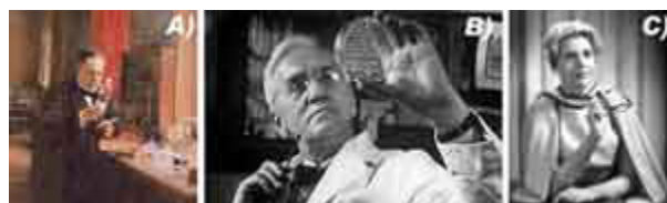
Figura 1. A) Louis Pasteur, quien descubrió que las enfermedades infecciosas eran causadas por microorganismos. B) Alexander Fleming, quien descubrió el primer antibiótico, la penicilina. C) Margaret Hutchington Rousseau, ingeniera química que diseñó la primera planta de producción masiva de penicilina.

Posteriormente a la producción en masa de la penicilina, se descubrieron y desarrollaron sintéticamente