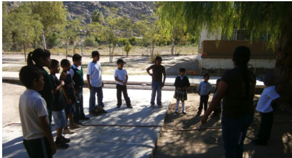
Actividades de enseñanza de lengua kumiai en La Huerta, Baja California.

Finalmente, los cucapá han encontrado en la enseñanza de cantos tradicionales una estrategia importante para impulsar la revitalización de su lengua, de modo que niños y cantantes dan nueva vida a las palabras cucapá. Este trabajo se complementa a su vez con el que una familia realiza en casa con los niños, involucrando a las madres y a la abuela, así como con un grupo conformado por varias adultas, algunos niños y una hablante que pacientemente les habla y les enseña cucapá.