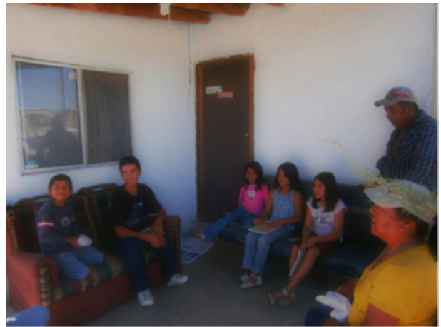
Niños paipai de San Isidoro, aprendiendo su lengua en Valle de la Trinidad, Baja California.

Por su parte, los paipai de San Isidoro que viven en el Valle de la Trinidad iniciaron, también en 2012, un proyecto para enseñar su idioma. Con el compromiso de dos hermanos, los pequeños que viven fuera de la comunidad han encontrado un espacio para volver a escuchar y practicar el paipai. A partir de esta experiencia, los niños que participan han revalorado su identidad étnica y se sienten orgullosos de ser indígenas paipai, involucrándose aún más con la reproducción de su cultura y de su lengua. Además, esto ha incluido retomar la realización de su fiesta tradicional. Esta iniciativa fue retomada también por un grupo paipai en la Comunidad Indígena Misión de San Catarina; se trata de una familia integrada por varios niños pequeños, algunas madres que entienden el paipai pero no lo hablan y una abuela que quiere que sus nietos vuelvan a usar su idioma.