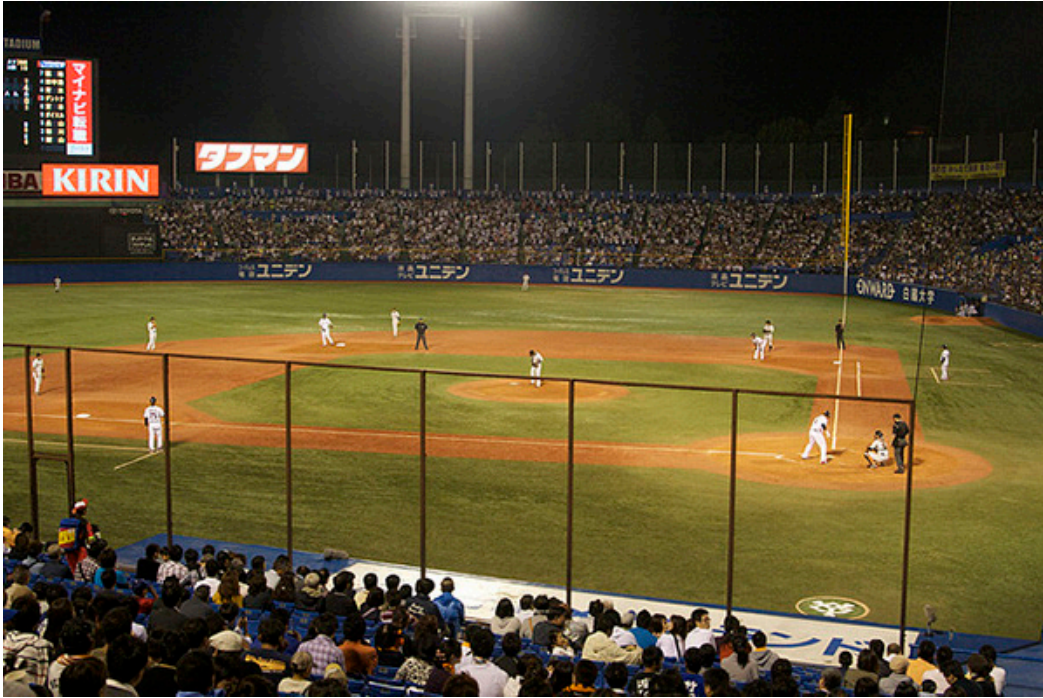
El estadio de beisbol de los Yakult Swallows

La mayoría de sus historias son complejas, surrealistas, oníricas. Uno no entiende bien a bien de qué va todo hasta ya avanzada la trama. Simplemente nos dejamos llevar, fuimos de párrafo a párrafo, de capítulo a capítulo. Con él avanzamos despacio, sin prisas, y poco a poco las piezas del rompecabezas van encajando en su sitio. Y nosotros nos dejamos sorprender, nos dejamos deslumbrar por la fantasía, por lo irreal pero aparentemente lógico que es todo en ese mundo Murakiano.