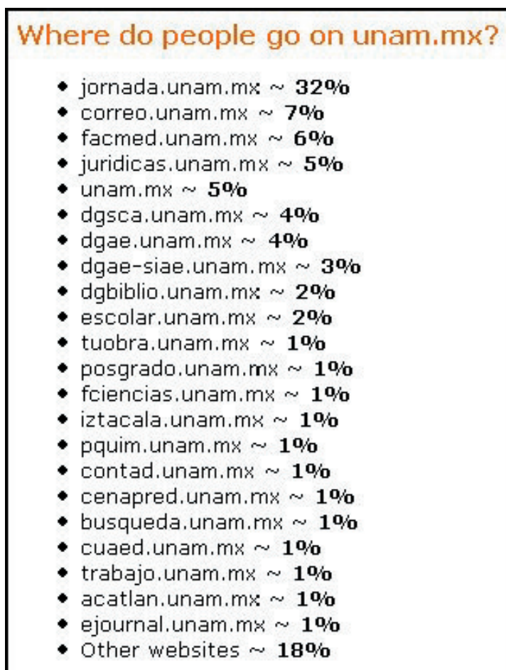
Gráfico 3. Los principales subdominios de la UNAM de acuerdo con el número de visitas interceptadas por Alexa (abril de 2005)

En ambas listas aparecen varias instituciones y servicios que parecen estar logrando un desempeño notable. CENAPRED y el Instituto de Investigaciones Jurídicas, junto con los servicios bibliotecarios, aparecen bien posicionados. El sistema Latindex, que centraliza el directorio latinoamericano de revistas científicas y tiene su sede en la UNAM, tiene una gran visibilidad internacional así como los servicios de cómputo y administración. El creciente éxito de los estudios a distancia (el modelo de Open University ) puede contribuir al éxito de visitas de todos los programas de posgrado que incluyen este tipo de posibilidad. Sin embargo, la presencia de facultades de ciencias y medicina entre las más visitadas, pero no entre las más visibles podría tener que ver con el idioma de sus páginas. Hoy por hoy, el inglés es la lengua franca de la comunicación científica y parece recomendable que la producción científica aparezca, además de en español, en este idioma.