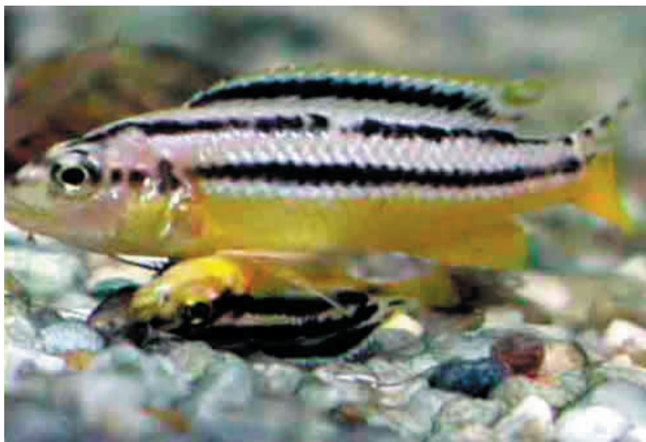
(Fig. 1) Los Melanochromis auratus , siamés vivo isquiópagos organismos unidos por el vientre.

Dada a las diferentes uniones corporales en humanos, a los gemelos siameses se les ha clasificado como: toracópagos, aquellos que están unidos por el tórax, craniópagos unidos por el cráneo, pigópagos unidos por los glúteos y los isquiópagos, unidos por el vientre. Con respecto a las características que presentaron las siamesas de Melanochromis auratus , correspondía a un isquiópagos, ya que estos organismos se encontraron unidos por el vientre (Fig.1), encontrándolos también en la clasificación de asimétricos, en donde un gemelo es más pequeño y depende del otro. Las siamesas, pertenece a la familia Cichlidae, una especie endémica del lago Malawi en África. La especie Melanochromis auratus , presenta una coloración llamativa: las hembras son amarillas con tonalidades doradas en la mitad inferior del cuerpo y con franjas negras y blancas en la mitad superior. Cuando estos son crías es difícil determinar su sexo, ya que todos presentan las características de una hembra, que son siempre menos oscuras que los machos. La reproducción de M. auratus es ovípara y con incubación bucal, el macho fecunda los huevos dentro de la boca de la hembra y esta cuida celosamente sus crías. Cabe mencionar que es de uso ornamental y son peces con comportamiento territorial agresivos.