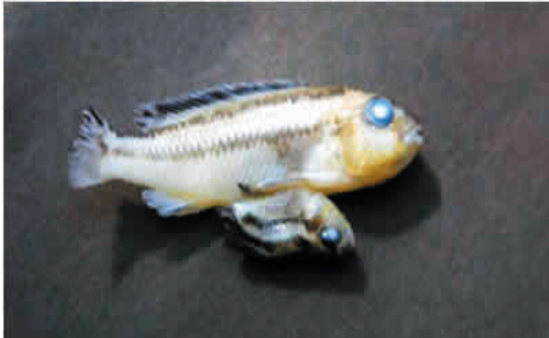
(Fig. 2) siamés Melanochromis auratus , alcanzaron una talla, para el organismo mayor y en posición normal de 7.76mm LT, mientras que su hermano en posición ventral media solo 5.44mm LT.

media solo 5.44 mm de longitud total (Fig.2.) Tras su llegada, se mantuvieron vivos un año y medio, permaneciendo aislados de otros organismos y especies, para evitarles cualquier daño o ataque. Díaz-Pardo y Godínez-Rodríguez (1991), mencionaron que en los animales se presentan variaciones ordinarias con pequeñas o grandes diferencias, pero cuando estas son demasiado profundas, pueden ser clasificadas como deformidades o anomalías. En los peces las anomalías de gemelos siameses parecen ocurrir con muy poca frecuencia. Dawson (1966); Dawson y Heal (1976) revisaron las publicaciones con respecto al tema y mencionan que se han registrado en