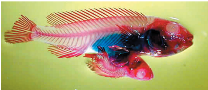
(Fig. 3) Estos dos organismos de Melanochromis auratus , ya transparentados y teñidos, se observa que comparten los órganos internos

tres familias de Elasmobranquios y aproximadamente en 12 teleósteos. Díaz-Pardo y Godínez-Rodríguez (op cit), reportaron un ejemplar siamés en Goodeidos ( Chapalichthys encaustus ), encontrados durante la identificación de organismos procedentes del manantial "los negritos" en Villamar, Michoacán, México, así mismo, Chávez y Saucedo (1988) describieron a siameses del bagre Arius felis , procedentes de un ambiente estuarino de Yucatán, México. Sin embargo para la familia Cichlidae no se había reportado ningún ejemplar siamés.