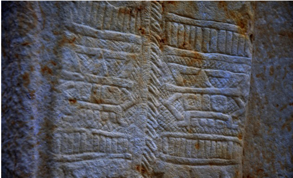
Figura 7b. Estela 2 Bonampak. Detalle.

Acerca del significado de la imagen de Tláloc, Arellano (2003:147) menciona que hay consenso en que se trata de una deidad bélica. Aparece relacionada con armas y rodelas; con los gobernantes sobre sus cautivos de guerra; con ritos de sangrías rituales, a manera de invocaciones para que se manifestara concretamente en la forma de los antepasados; y en específico, con los fundadores de las dinastías reinantes. Es posible entonces que a través de estos significados el dios llamado Tláloc sea una advocación del Monstruo de la Tierra, común en la iconografía maya. Por otro lado, el tocado con signo del año característico de la imagen de Tláloc, quizás responde al relato del origen del tiempo según el Chilam Balam de Chumayel, y serviría como recordatorio de aspectos fundamentales de la Cosmogonía: El instante en que los dioses crearon, junto con la tierra, al tiempo. (Arellano, 2003: 147).