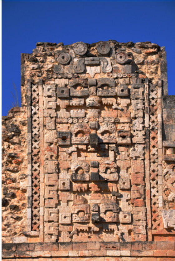
Figura 2. Remates del cuadrángulo donde se identifica una imagen de Tláloc sobre 4 representaciones de Chac.