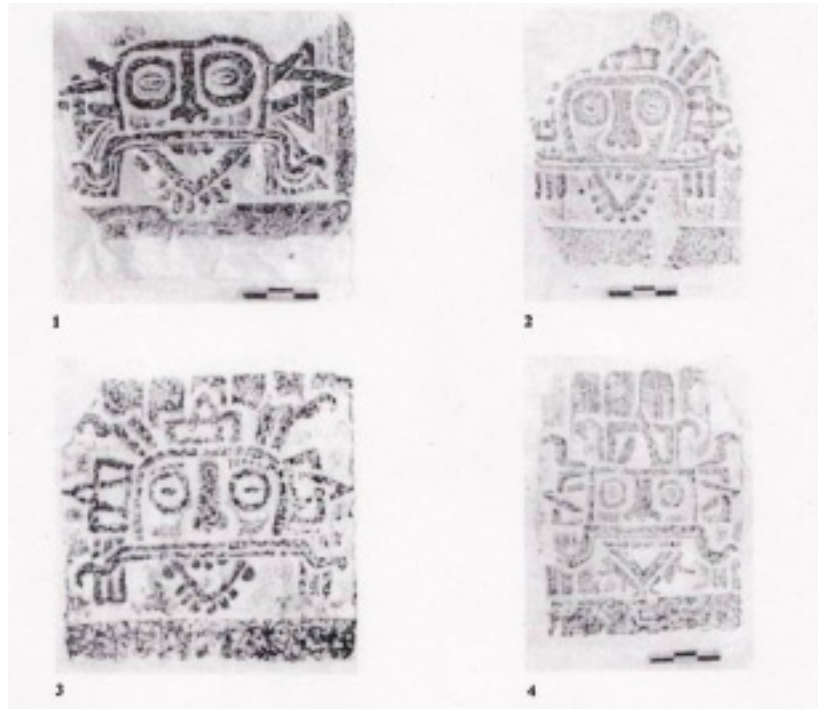
Figura 4. Dibujos de los Tlálocs presentes en el Templo de El Adivino. Dibujos de Rubén Maldonado. Tomados de y Maldonado y Repetto Beatriz. 1988 Los Tlálocs de Uxmal. En Revista de Antropología Americana. No. XVIII. Universidad Complutense de Madrid. Madrid, España.