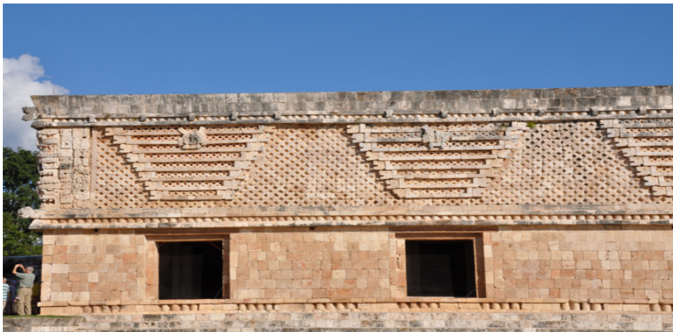
Figura 5. Estilo Puuc. Uxmal. Cuadrángulo de las Monjas. Edificio Este.

Otro punto de estudio a considerar es el propio estilo arquitectónico de Uxmal, el llamado estilo Puuc. El término maya yucateco Puuc ha adquirido varias connotaciones en la literatura antropológica, se le ha utilizado para designar un área geográfica, una región arqueológica y un estilo arquitectónico, así como un período en la historia de los mayas, en esencia tiene un significado geográfico cultural. La definición más antigua del vocablo proviene del diccionario de Motul y de acuerdo a éste, Puuc quiere decir: “Cerro, monte o sierra baja o cordillera de sierra.” (Barrera, 2005: 19).