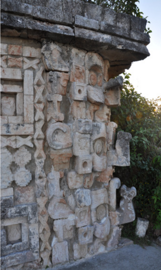
Figura 6. Estilo Puuc, Chac. Uxmal. Detalle, Foto Isabel Mercado Archila.

La ornamentación de los edificios Puuc por lo común se concentra en la parte superior de la fachada. En su elaboración se utilizó la técnica conocida como mosaico de piedra, en la que se tallan previamente los elementos decorativos. Las formas de los motivos son principalmente geométricas: columnas remetidas, bandas cruzadas o celosías, columnas de mascarones de Chac, usualmente dispuestas en las esquinas ( Fig. 5 ) (Barrera, 2005: 24). Así, grecas, celosías, columnas, tamborcillos, mascarones y serpientes, se conjugan armoniosamente para lograr un equilibrio formal absoluto. (Foncerrada, 1965:39)