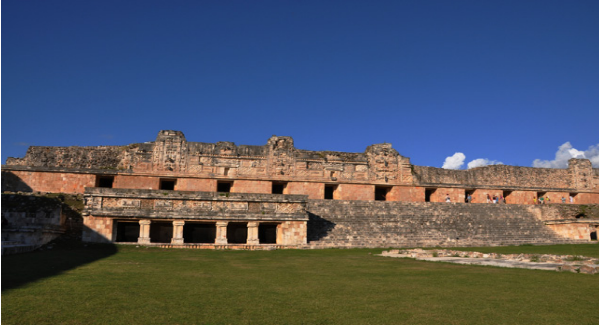
Figura 1. Cuadrángulo de las monjas vista general frente lado norte.