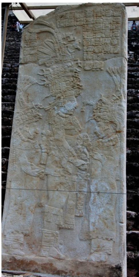
Figura 7. Estela 2 Bonampak. Detalle.

Viajaron ideas y formas estilísticas de norte a sur y de sur a norte y el período clásico es un ejemplo del contacto vital que debió haber existido entre focos culturales significativos, llámese Tajín, Xochicalco, Teotihuacán, Kaminaljuyú o Monte Albán. (Foncerrada, 1965:37)