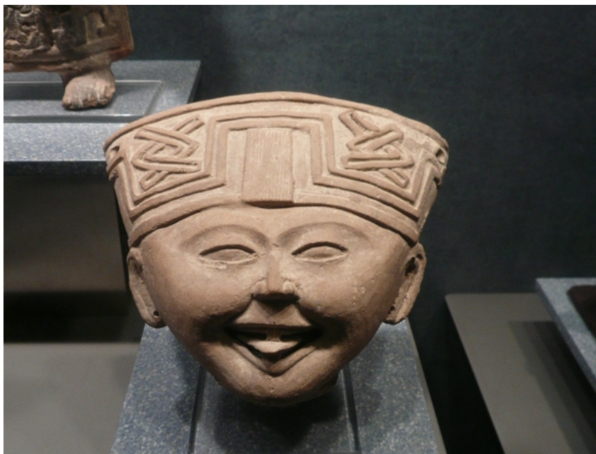
Figura 8. “Carita Sonriente” Totonaca. Museo Nacional de Antropología.

La imagen sonriente de los Tlálocs del Adivino son intrigantes, precisamente por representar a la deidad sonriendo. La sonrisa como elemento expresivo de la plástica prehispánica, fue un recurso que manejó magistralmente la escultura totonaca ( Fig. 8 ) (Foncerrada, 1965:15).